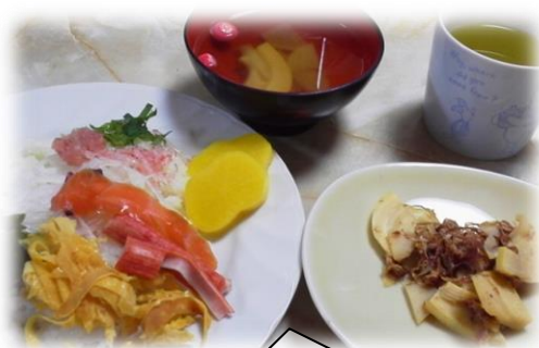
かいせんだん ふう 海鮮丼～風～ 定食

4月某日、ランチメニューの案を出し合いました。 「オムライス!」「ハヤシライス!」「カレーライス!!」 この辺までは、いつも出る定番意見。ところが… 「納豆」とか「お茶漬け」とかって、やったことないよね。」 「何でも言っているの?」「一つの意見だから」すると… チンジャオロースー・回鍋肉・エビチリ・ビビンバ・北京ダ ック・鰻・石狩鍋・海鮮丼… 次から次と 尽きない意見。